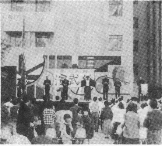
昨年の演武祭より

時の過ぎるのは早いもので、今年もまた学園祭の季節となりました。淀祭も今年で第38回を数えるに至り、新たな一ページを書き加えようと実行委員一同、張り切っております。扱って、今年はテーマを「現在」と瞬間を」と掲げました。最近、時の流れに流され、ただ毎日を無難に過ごしている人達が多いように思います。もつと時間を大切に、「現在」を有意義に過ごしてもらいたいと思います。しかし、日頃授業のくり返して単調な毎日の中では、なかなか頭の