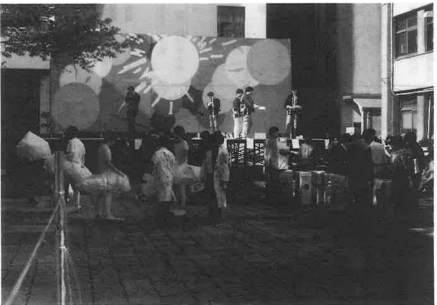
淀祭風景 於 東中庭にて