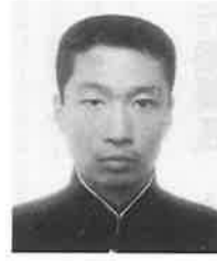
新入生諸君、御入学おめでとう ございます。