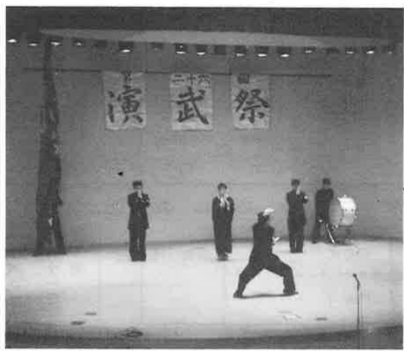
平成3年度 演武祭風景 於・記念講堂

体育会総合合宿 八月十三日(日)～十九日(土) 石川県能登郡日野町 (体育会本部) 我が体育会本部主催で八月二十三日(日)～二十九日(土)に かけて、石川県能登郡で、体育会総合合宿を行いました。参加クラブは、バトミントン部、空手道部、剣道部、正統少林拳法部、不動拳少林拳法部で二百二十名を越える人数でした。施設が充実しており、体育会という事で、練習で汗をかき、疲れが翌日に残らず練習に専念できる温泉場を探した所この場所が決まりました。近年、国体が行われた所だけあり、予想以上のすばらしい施設で、宿泊所も綺麗、食事も豪華で全クラブ満足してもらったと思います。又、環境も良かったのですが、店等も近くに有り便利が良かったです。数人の怪我人は出ましたが、大きな事件はなく、終わらせる事ができました。 総合合宿中、忙しいうち、来ていただいた諸先生方、学生課の方々を中心に厚くお礼申し上げます。 硬式野球部 八月十三日(日)～二十一日(日) 岡山県道後温泉 私達の合宿は岡山の道後温泉で合宿をしました。気候は大阪よりずっとすずしく、けっこう良い環境の中で、集中した練習ができて、総合合宿であったと思います。参加クラブは、バトミントン部、空手道部、剣道部、正統少林拳法部、不動拳少林拳法部で二百二十名を越える人数でした。施設が充実しており、体育会という事で、練習で汗をかき、疲れが翌日に残らず練習に専念できる温泉場を探した所この場所が決まりました。近年、国体が行われた所だけあり、予想以上のすばらしい施設で、宿泊所も綺麗、食事も豪華で全クラブ満足してもらったと思います。又、環境も良かったのですが、店等も近くに有り便利が良かったです。数人の怪我人は出ましたが、大きな事件はなく、終わらせる事ができました。