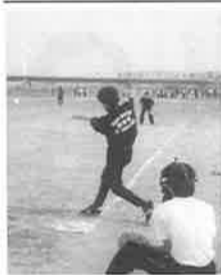
学内素人日本拳法大会

今年は一班に分れての展示で、 I.M(インダストリアルマネジメン ト)班は、企業に於ける外国人労働者 の立場や、日本人がどの様に思っ ているかなどを検討・調査する。S E(システムエンジニアリング)班は、 ISO14000シリーズの品質管 理について調査する。そしてこれら 詳細な文献をまとめたものも展示 する。