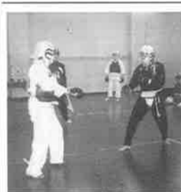
学内素人日本拳法大会